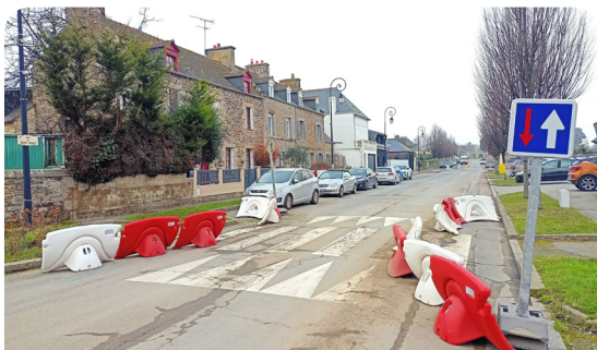
Chicanes, balises et plots sont actuellement testés rue de Saint-Malo. Ils suggèrent ce que pourraient être les futurs aménagements.

Depuis près de 4 mois, la commune expérimente un dispositif sur une partie de la Grande rue et la rue de Saint-Malo, visant à réduire la vitesse des véhicules et à améliorer la sécurité des riverains et des usagers de ces deux voies contiguës. Ce dispositif est complété par une priorité à droite de la rue des Pinsons sur la rue de Saint-Malo.