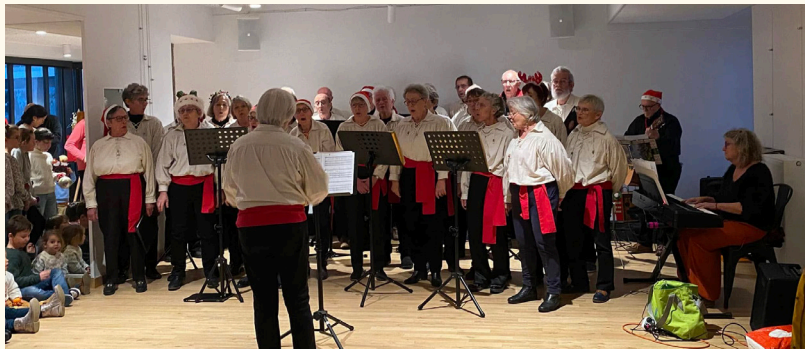
Pour leur Fête de Noël, les conseillers municipaux juniors avaient programmé le groupe vocal "La Mal'O Chansons"