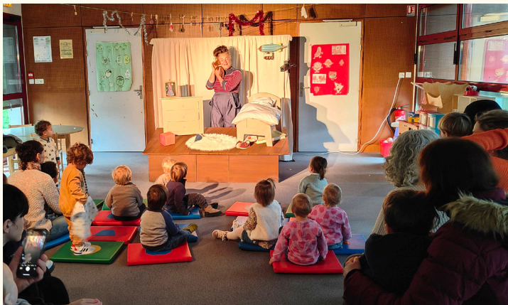
Le spectacle "Lutins-lutins" du Théâtre des 7 Lieux, joué devant les tout-petits de la micro-crèche